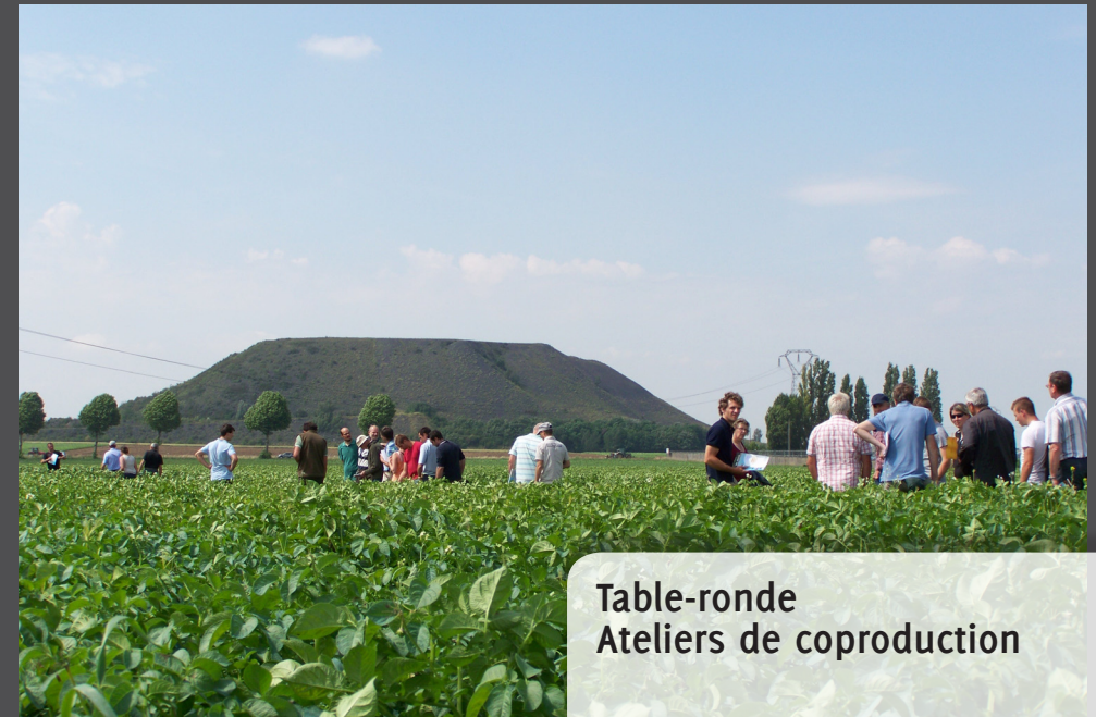
Table-ronde Ateliers de coproduction

Pour des systèmes agroalimentaires au service de territoires durables : quels nouveaux modèles économiques ?