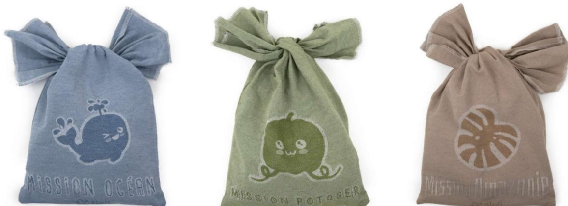
Photo : les pochons de rangement de nos jeux, en tissu recyclé